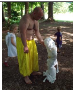
Ingewikkelde kinderen, ze bestaan!