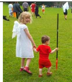
Engel of bengel?