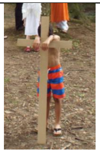
Ieder kind heeft zijn kruisje