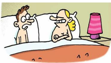
- De bondscoach heeft gezegd: "Geen seks voor de match!"

bestaat ook in boslims (groen) soslims (rood)